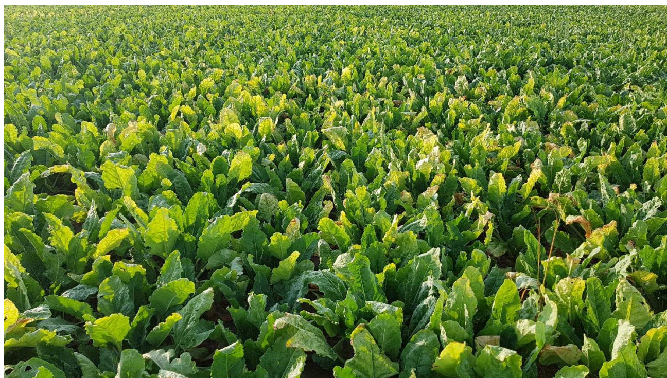
1er foyer de jaunisse caractérisé par la forme circulaire à ne pas confondre avec un dessèchement des feuilles.