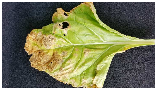
Bout de feuille desséchée même en limon profond suite à la canicule.