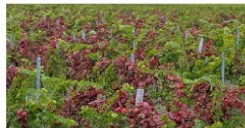
Parcelle de vigne contaminée par la flavescence dorée

Fin 2022, la zone délimitée de lutte est étendue à 2 localités proches de Trélou/ Marne, les communes de Passy/Marne et de Barzy/Marne. La stratégie d'éradication et la surveillance renforcée seront poursuivies en 2023.