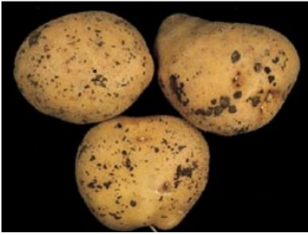
Sclérotés sur tubercules