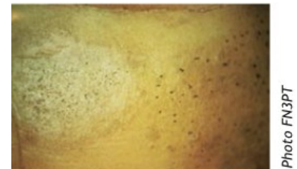
Gale argentée Dartoise