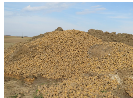
Tas constitué de déchets et d'écarts de triage en 2016