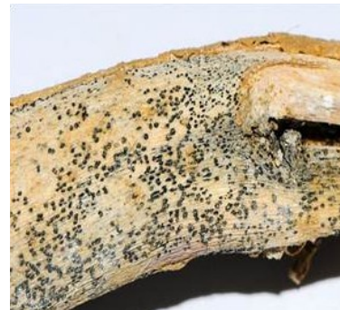
Symptômes de dartoise sur tige