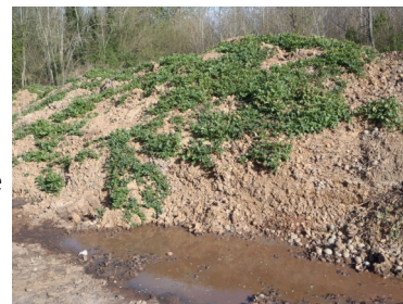
Écoulement de jus sur un tas non géré