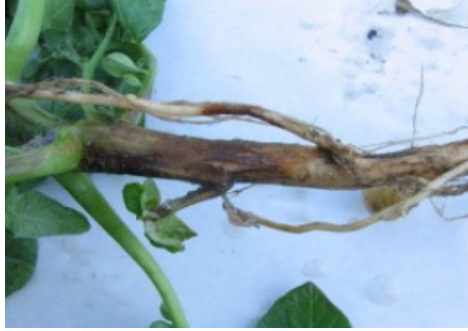
Attaque sur tige