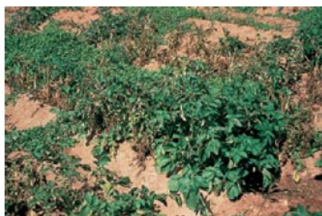
Zone contaminée par les nématodes

En parcelle, lors de fortes contaminations, il est possible d'observer les kystes à l'œil nu sur les racines. Les kystes peuvent contenir plus de 100 larves microscopiques, ce sont elles qui vont pénétrer dans les racines, créer des nécroses et stresser la plante. Ces kystes peuvent subsister dans le sol pendant de nombreuses années.