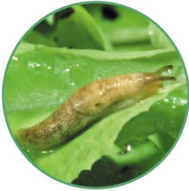
Limace grise adulte