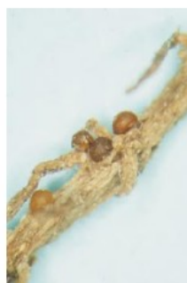
Kyste sur une racine