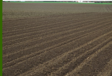
Fourrière plantée le 16 mars à Vermelles (Artois).

Les plantations, qui avaient timidement commencé mi-mars en variétés précoces, redémarrent cette semaine à la faveur de conditions météorologiques douces et ensoleillées (Annœullin, Saint Omer...).