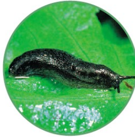
Limace noire adulte