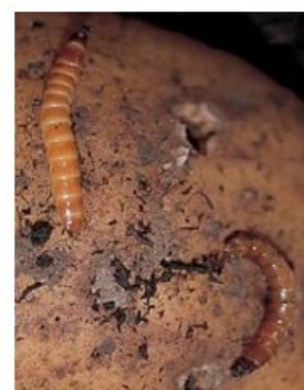
Larves de taupin