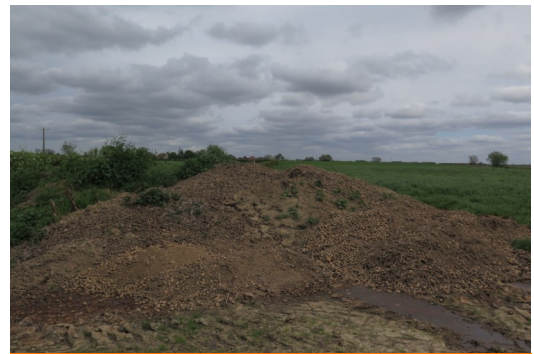
Tas de déchets avec quelques repousses situé à Oudezeele (59)