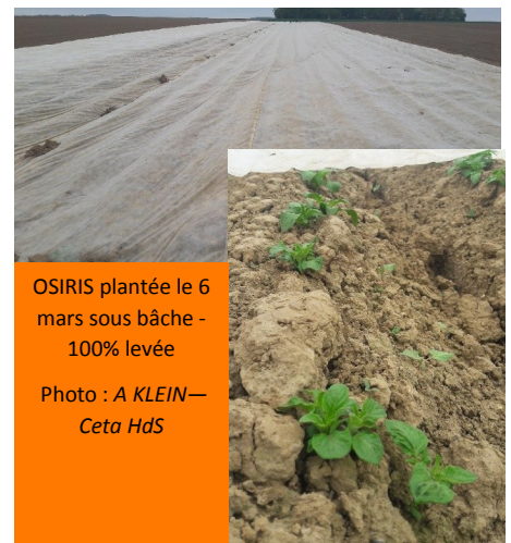
OSIRIS plantée le 6 mars sous bâche - 100% levée