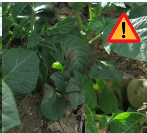
Mildiou sur tas de déchets à Staples rue Borre Becque, symptômes sur feuilles et tiges.