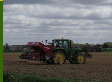
Chantier de plantation hier à Staples (59)