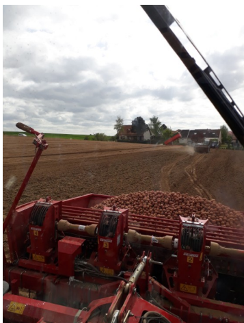
Plantation de pommes de terres de consommation secteur Saint Ouen

METEO : Les températures sont de nouveau de saison avec des maximums aux alentours de 16°C. Quelques ondées sont annoncées courant de semaine mais elles ne devraient pas perturber les chantiers de plantation. Une perturbation devrait arriver à compter du week-end avec une dizaine de millimètres prévus à ce jour.