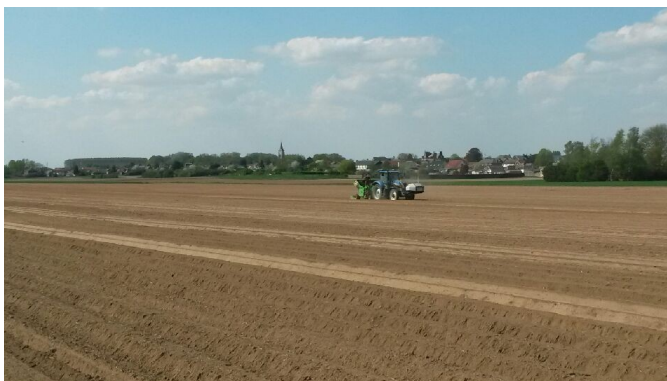
Chantier de Plantation dans le Cambrésis vendredi dernier.