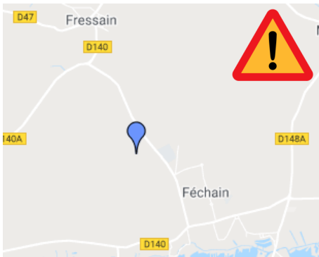
Tas de déchets avec repousses et mildiou à Féchain route de Fressain (59)

Le tas situé à Mont Saint Eloi a été débarrassé.