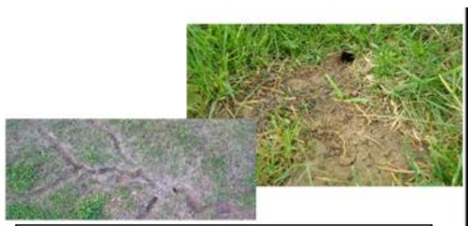
Photographie n°3 : Signes d'activité du Campagnol des Champs

En ce début de campagne 2018-2019, avec les semis d'automne et les conditions climatiques favorables au ravageur, un certain nombre de cultures pourrait être touché, notamment à proximité des zones où la présence du ravageur a été identifiée lors de la campagne précédente. N'hésitez pas à prendre contact avec l'animateur filière ou à saisir les observations réalisées sur les outils de saisie Vigicultures ou Vgob's.