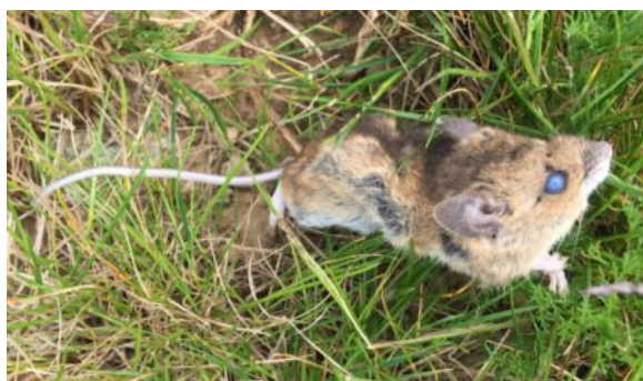
Photographie n°2 : Mulot sylvestre capturé sur le site d'Aizecourt le Haut