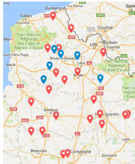
Graphique n°1 : Cartographie remon- tées campagnols Hauts-de-France (F.RE.D.O.N. de Picardie)