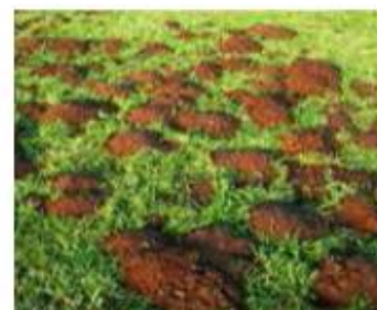
Photographie n°4 : Signes d'activité du Campagnol Terrestre