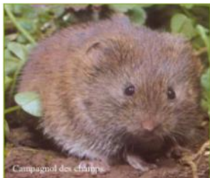
Photographie n°1 : Campagnol des champs en parcelle

À l'issue du Comité Régional d'Epidémiologie du 23 juin 2017, un réseau de surveillance « Campagnol » a été mis en place sur les départements de l'Aisne, l'Oise et la Somme. Son objectif est d'acquies des données sur les nuisibilités des Campagnols et d'apprécier leur dynamique sur le territoire régional en fonction