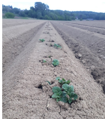
Pomme de terre plantée le 7 avril—(Crisolles 80)