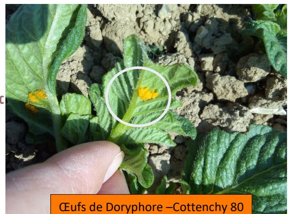
Œufs de Doryphore –Cottenchy 80