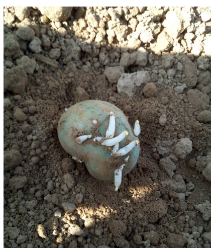
Nazca plantée le 15 avril— Aizecourt le Haut