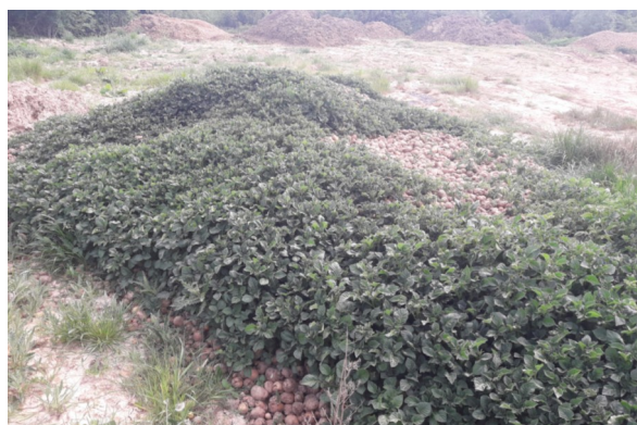
Tas de déchets sur la commune de Montreuil aux Lions (02)