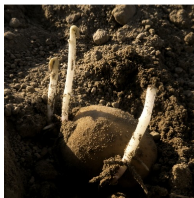
Adora plantée le 4 avril— Jenlain (59)