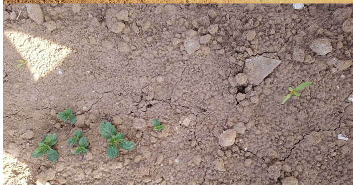
Repousses de pommes de terre en parcelle de Betteraves — secteur Arras