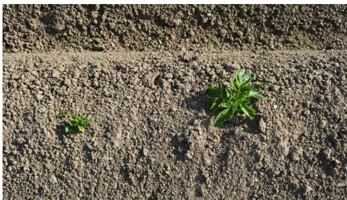
Parcelle levée à 80% - bouquet 2 à 5 cm — Plantation 20 mars - Lorgies (62)