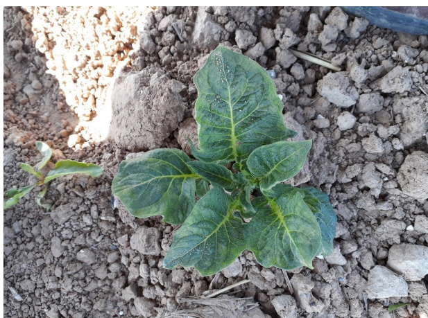
Repousses de pommes de terre dans parcelle de Betteraves