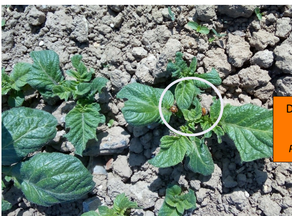
Doryphores adultes Cottenchy 80

En 2019, à la même date, nous avons très peu d'adultes de sortis et pas encore d'œufs présents, ce qui peut s'expliquer par un début de printemps plus froid que cette année.