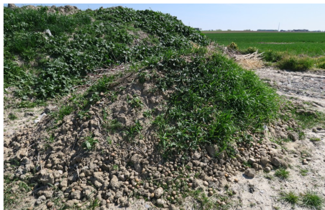
Tas de déchets avec repousses à West Cappel (59)