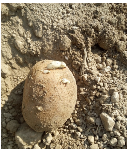
Fontane plantée le 13 avril— Pontru (02)