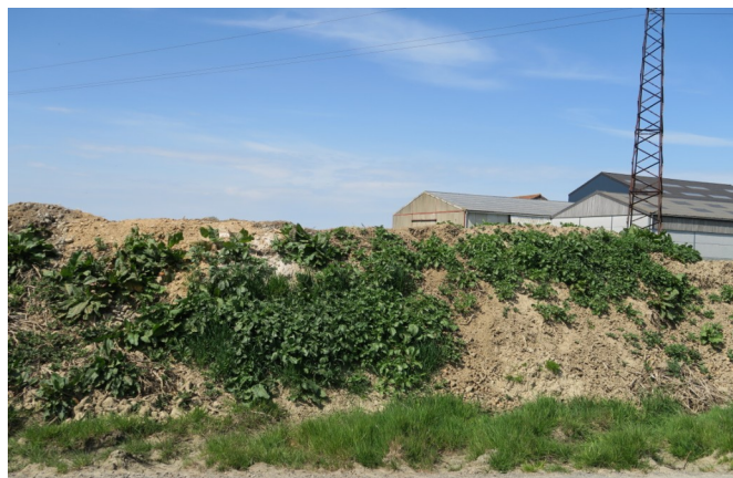
Tas de déchets avec repousses à Rexpoede (59)