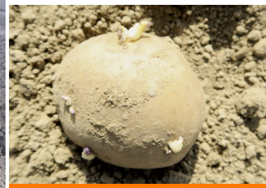
Fontane plantée le 17 avril— St saulve (59)