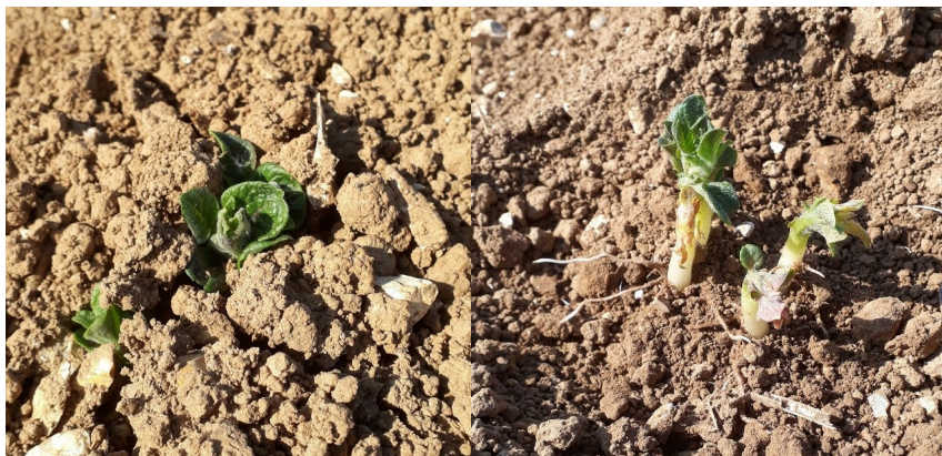
Pomme de terre plantée le 6 avril—Variété Eris (Beauval 80)

METEO : Une perturbation est présente sur notre région depuis hier soir, les pluies devraient perdurer toute la semaine et durant le week-end avec des températures en baisse autour de 15°C au meilleur de la journée.