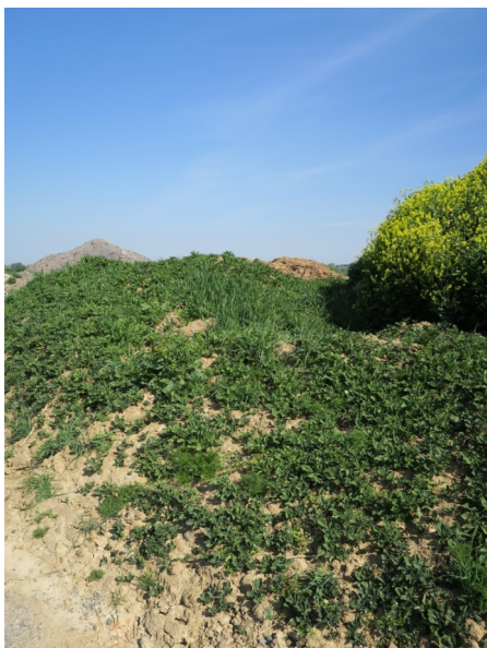
Tas de déchets avec repousses à Fleurbaix (59)

Des tas de déchets avec repousses ont été observés à Montreuil aux Lions et à Montdidier, sans présence de mildiou.