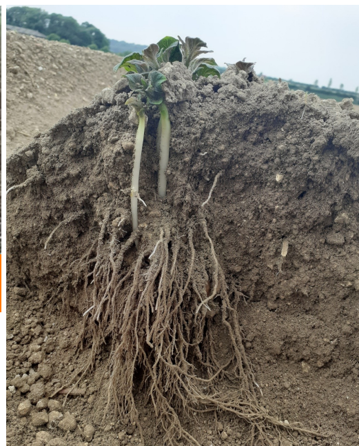
Variété Eris plantée le 4 avril—secteur Amiens (80)