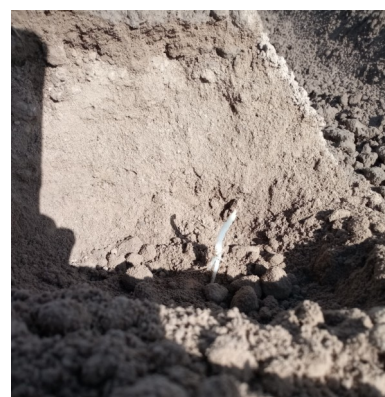
Fontane plantée le 9 avril à Orchies (59)