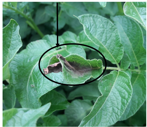
Mildiou sur tas de déchets non géré (Montreuil les Lions—02)