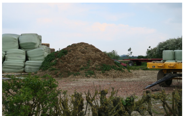
Tas de déchets non géré à Staples (59)