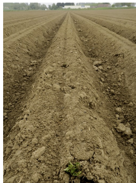
Adora plantée le 4 avril à Jenlain (59) - Stade émergence.