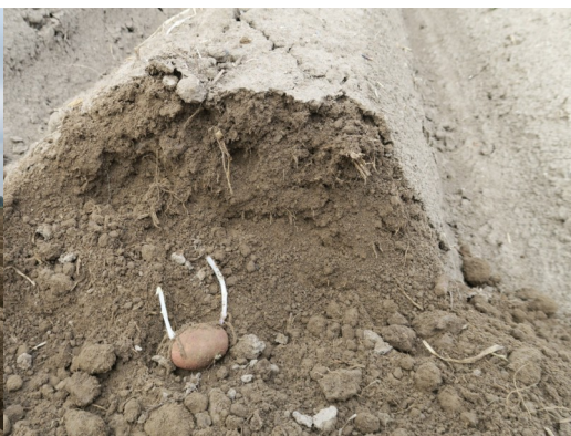
Fontane plantée le 16 avril à Deulémont (59) - Germes de 5 cm.