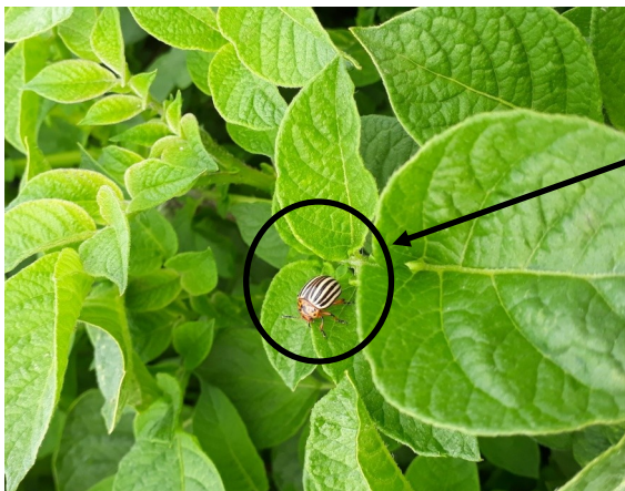
Pucerons, cicadelle et doryphore sur un tas de déchets en végétation (Secteur Doullens—80)

Florilège de ce qui est observé sur tas de déchets aujourd'hui : Pucerons, cicadelle, doryphore et mildiou