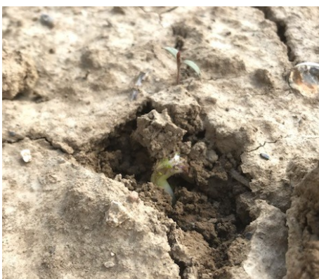
Lady Rosetta en cours de levée— Plantation le 9 avril -Lihons (80)

METEO : La météo annonce des températures en augmentation à partir de demain jusqu'à ce weekend (18 à 20°C l'après midi), accompagnées d'un temps sec et d'une hygrométrie peu élevée. Une nouvelle perturbation est annoncée à compter du week-end.