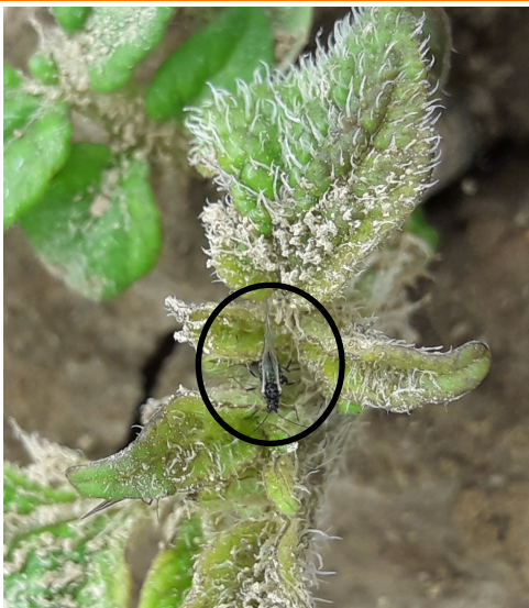
Puceron ailé sur pommes de terre levées (02)

Puceron ailé observé sur pomme de terre émergente en parcelle (Sud de l'Aisne).