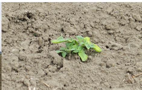
Parcelle levée, phytotoxicité herbicide—Secteur Comines (59)