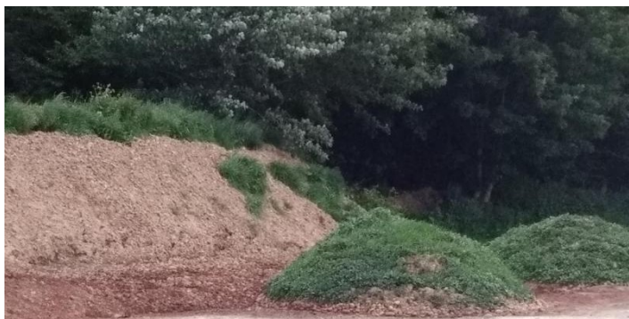
Tas de déchets non géré—Ligescourt (80)