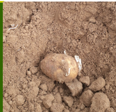
Variété Markies_ - Plantation le 19-04— secteur maritime 80

• Pucerons: Individu ailé observé sur une parcelle levée