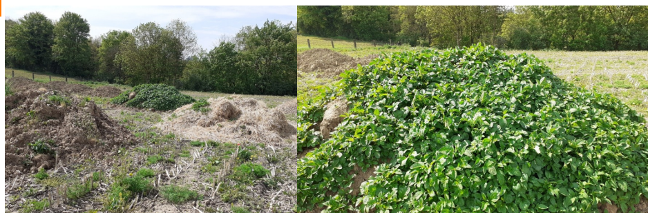
Plusieurs tas de Tas de déchets non gérés dans une même parcelle à Carency (62)