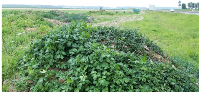
Tas de déchets non gérés à Cantin (59) le long de la D643