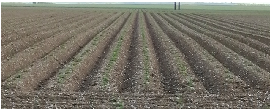
Parcelle en début de levée (plantation fin mars) - Secteur Amiens (80)