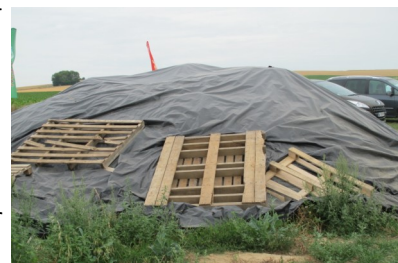
Tas de déchets bâché (photo d'archive)

RAPPEL : la gestion des repousses sur tas de déchets est obligatoire et fait l'objet d'arrêtés préfectoraux dans le Nord et le Pas de Calais (disponibles auprès du SRAL tel : 03.21.08.62.70).