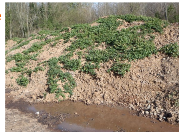
Écoulement de jus sur un tas non géré (photo d'archive)

N'épandez pas les déchets sur les parcelles cultivées et jachères après le mois de février car la destruction des tubercules par le gel est plus difficile.