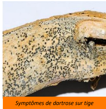
Symptômes de dartoise sur tige