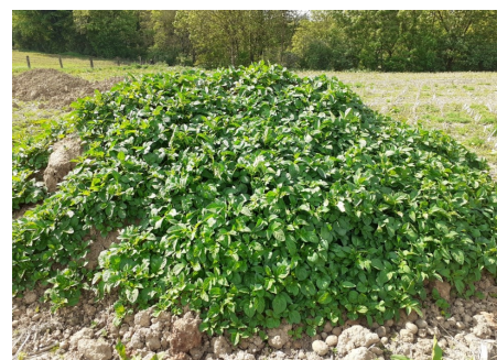
Repousses sur un tas constitué de déchets et d'écarts de triage (photo d'archive)