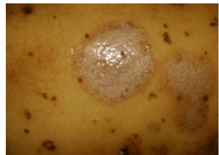
Gale argentée sur tubercule