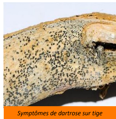
Symptômes de dartoise sur tige