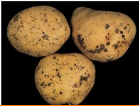
Sclérotés sur tubercules