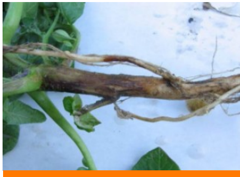
Attaque de rhizoctone brun sur tige