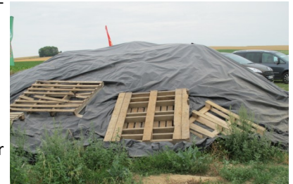
Tas de déchets bâché (photo d'archive)