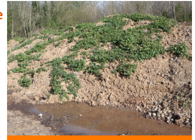
Écoulement de jus sur un tas non géré (photo d'archive)

N'épandez pas les déchets sur les parcelles cultivées et jachères après le mois de février car la destruction des tubercules par le gel est plus difficile.