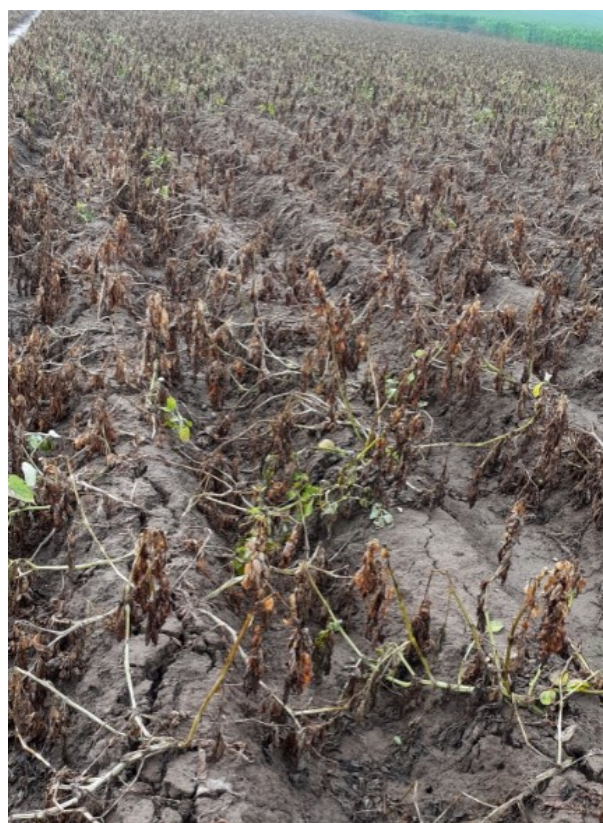
Variété Colomba— 10 jours après défanage (62)