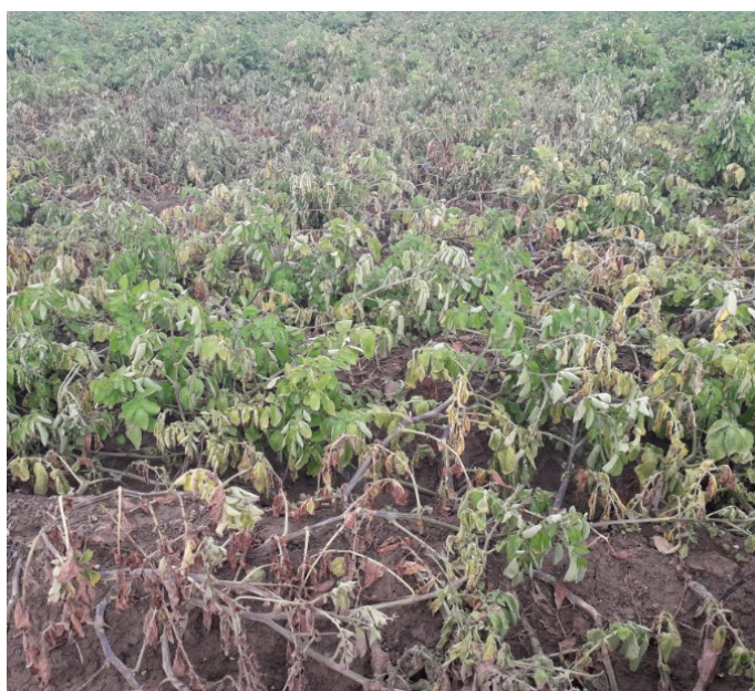
Eau ayant stagnée entre les buttes—Richebourg (62)