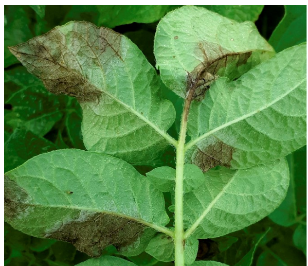
Mildiou sur face inférieure de la feuille