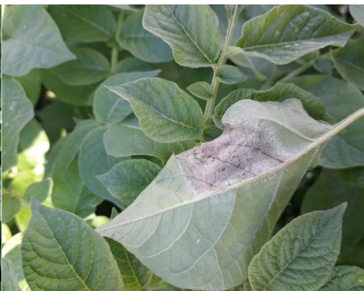
Mildiou sporulant — Secteur Richebourg(62)