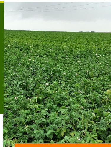
Variété Fontane — fin floraison, tout début sénescence — Fampoux (62)

OBSERVATIONS : 52 parcelles ont été observés cette semaine.