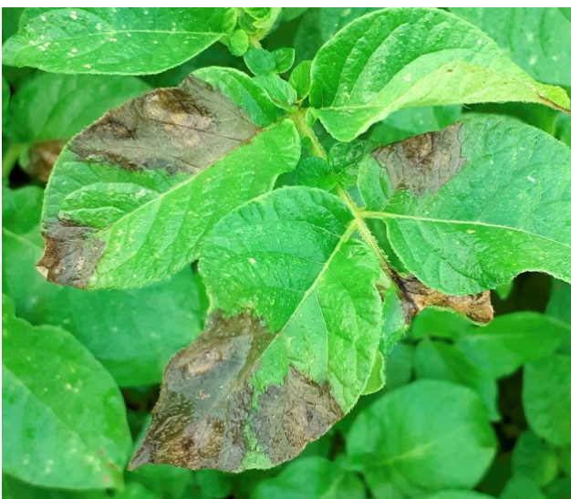
Mildiou sur face supérieure de la feuille

En cas de forte infestation, ne relâchez pas la protection pour contenir au maximum la maladie et freiner sa dispersion dans l'environnement. En cas de foyers isolés, appliquez un défanant ou enlevez les fanes manuellement et sortez les de la parcelle (les transporter dans des sacs plastiques pour éviter la dispersion de l'inoculum dans la parcelle).