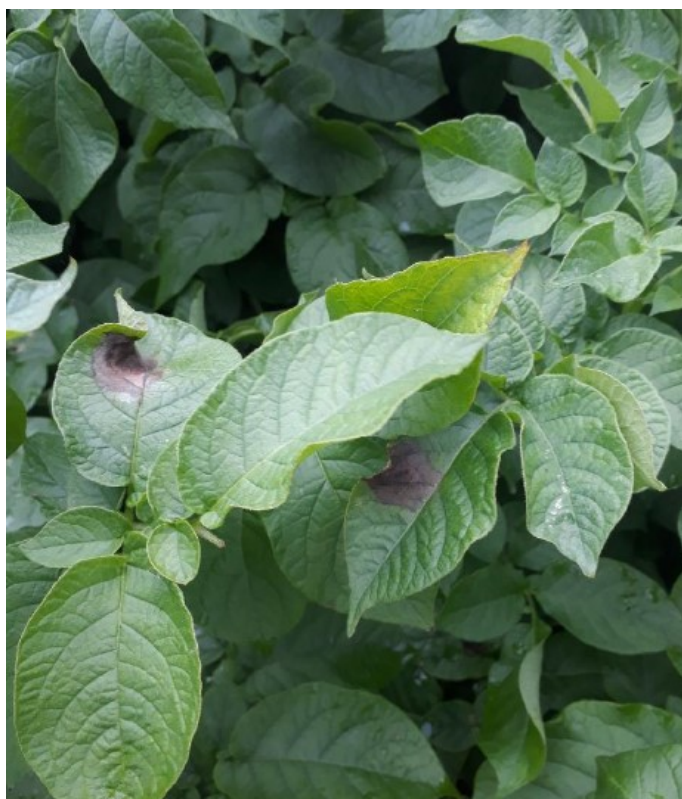
Mildiou sur feuille variété Fontane—Secteur Abbeville (80)