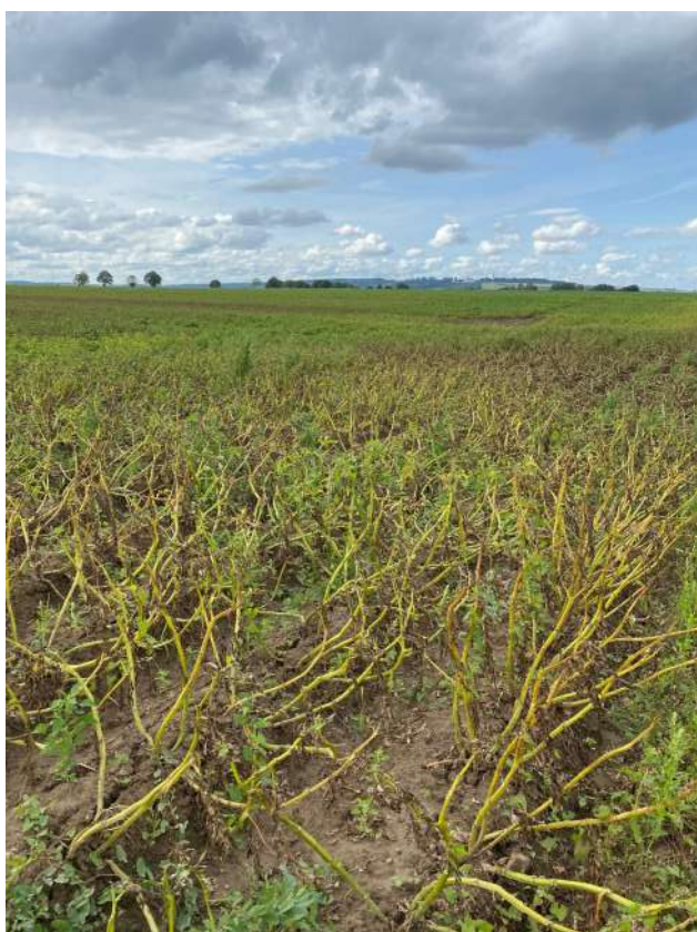
Zone de parcelle détruite par le mildiou (62)