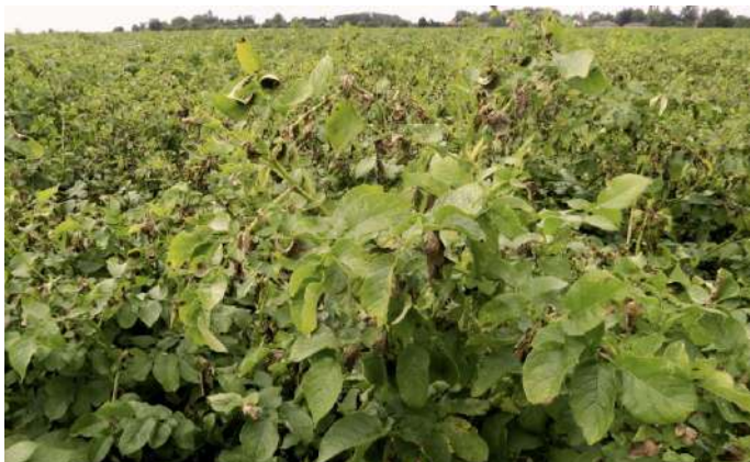
Foyer de mildiou