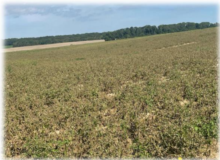
Parcelle détruite par le mildiou variété Fontane — Grougis (02)