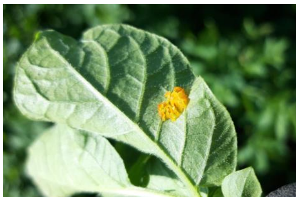
Ponte de Doryphores Adultes de 2ème génération

Le seuil indicatif de risque n'est pas atteint