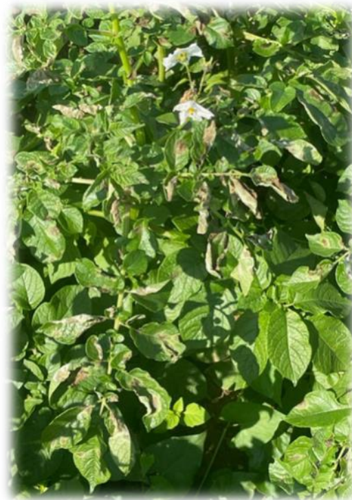
Attaque de Milidou variété Fontane — Grougis (62)