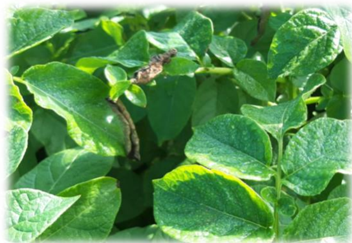
Symptômes suite au vent