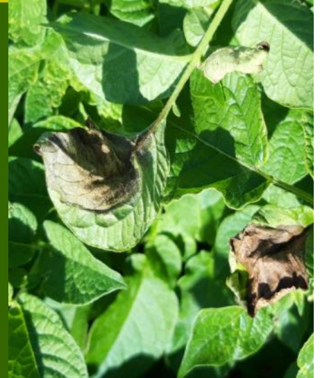
Mildiou en cours d'assèchement — Armouts Cappel (59)

• Alternaria : En augmentation -> 56 % des parcelles avec présence