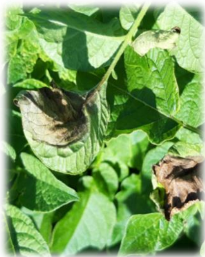
Milidou en cours d'assèchement — Armouts Cap- pel (59)